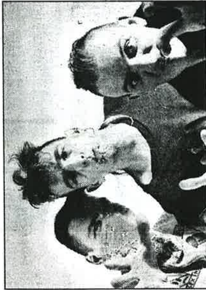
At CBGB, Happy Drivers displayed a worldview seemingly derived from Zap Comix.

Happy Drivers, who closed the show, played more conventional punque rock, although their bass player used an upright, a la the Stray Cats. Their worldview seems derived from Zap Comix, American western lore and skinhead pop culture. Live, they seemed quite derivative; the material on their import CD, "Happy Drivers," is slower, smarter, less predictable. On it, they do a great cover of Madonna's "La Isla Bonita." / M